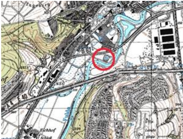
Abbildung: Lage des Geltungsbereiches